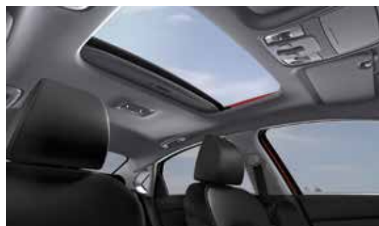
Electric Power Sunroof فتحة سقف كهرباء