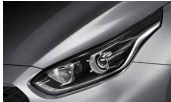
Halogen Projection Headlamps مصابيح أمامية هالوجين بعدسة لتحسين الرؤية