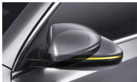
Electric Folding Outside Mirrors + Side Repeaters إشارات بالمرآيات الجانبية + طي كهربائياً