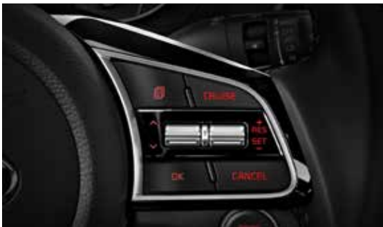
Auto Cruise Control with Steering Wheel Controls مثبت سرعة يتحكم من عجلة القيادة