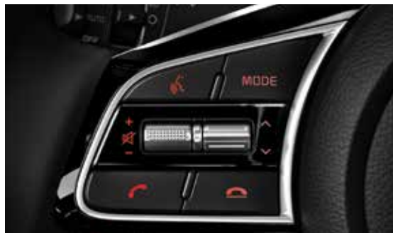
Audio & Bluetooth with Steering Wheel Controls تحكم بالنظام الصوتي والبلوتوث من عجلة القيادة