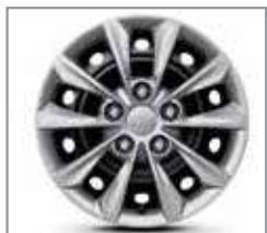
15-inch Steel Wheel 195 / 65