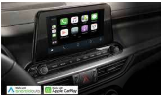
Supporting Android Auto & Apple CarPlay تدعيم Apple CarPlay & Android Auto