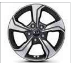
16-inch Alloy Wheel 205 / 55