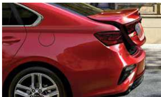
Smart Trunk شئطة ذكية الفتج