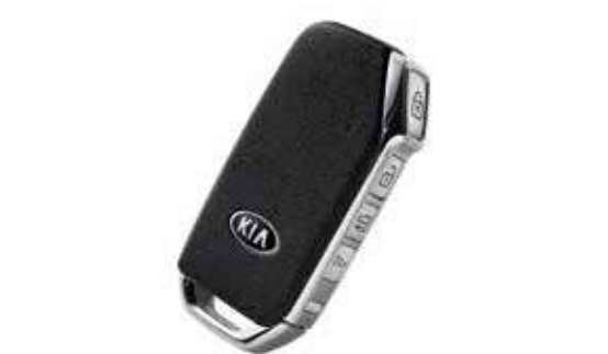
Remote Engine Starter إدارة المحرك عن بعد من الريموت