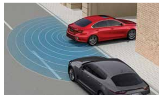
Rear Parking Assist System حساس ركن خلفي