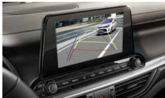
8 inch Touch Screen + Rear View Camera شاشة لمس مقاس ٨ بوصة + كاميرا خلفية