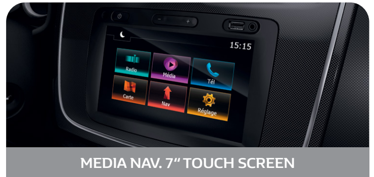
MEDIA NAV. 7" TOUCH SCREEN