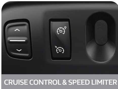
CRUISE CONTROL & SPEED LIMITER