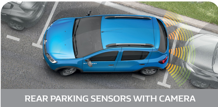
REAR PARKING SENSORS WITH CAMERA