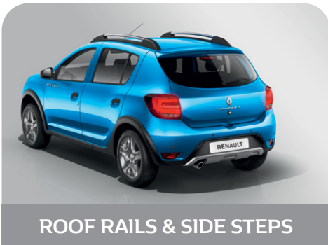
ROOF RAILS & SIDE STEPS